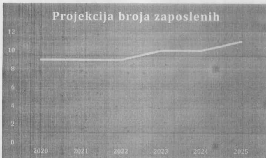
Grafički prikaz: Plan kretanja broja zaposlenih po godinama

Planirano kretanje broja zaposlenih prikazano je grafičkim prikazom u nastavku, a odnosi se na period od 2019. g. - 2024. g. Grafički prikaz prikazuje povećanje broja zaposlenih u odnosu na prethodne godine (prosječan broj zaposlenih) što je rezultat restrukturiranja tvrtke i povećanja prodaje do kojeg je došlo kroz projekciju budućeg poslovanja tvrtke.